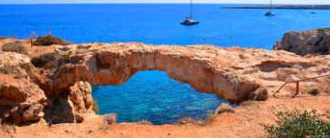
Skalny most na półwyspie Cape Greco Nikon D7100 ISO100 1/400s f/7.1 22mm