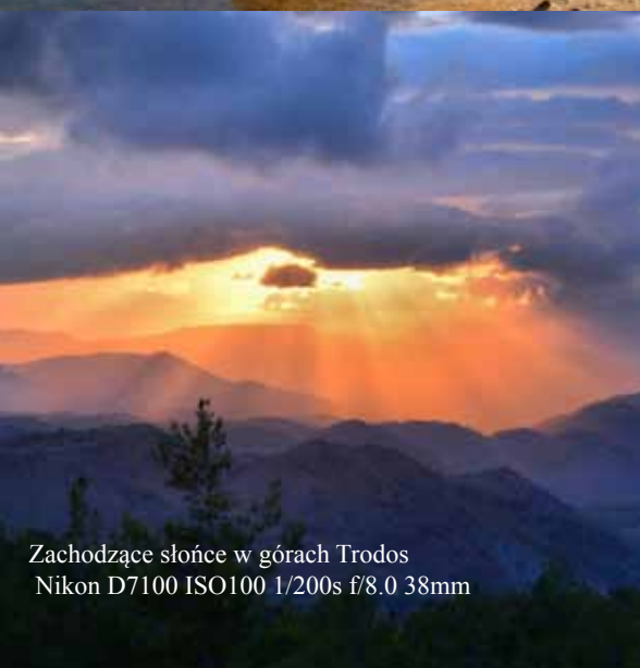
Zachodzące słońce w górach Trodos Nikon D7100 ISO100 1/200s f/8.0 38mm