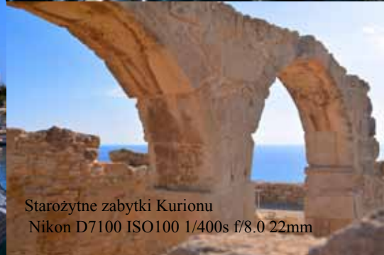
Starożytne zabytki Kurionu Nikon D7100 ISO100 1/400s f/8.0 22mm