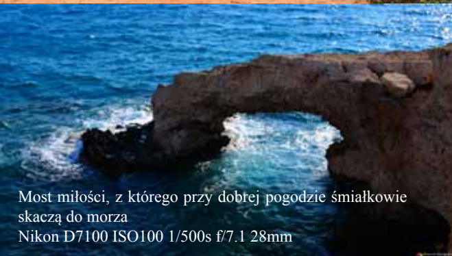
Most miłości, z którego przy dobrej pogodzie śmiałkowie skaczą do morza Nikon D7100 ISO100 1/500s f/7.1 28mm