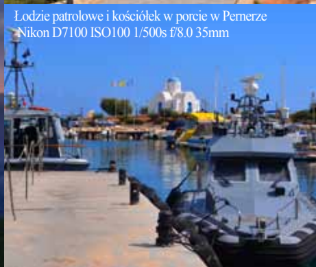
Łodzie patrolowe i kościółek w porcie w Pamerze Nikon D7100 ISO100 1/500s f/8.0 35mm