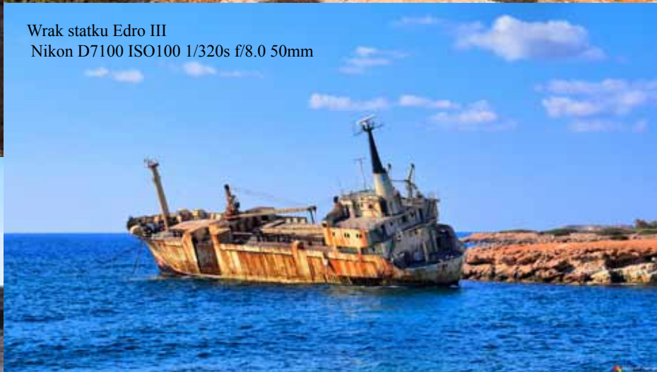
Wrak statku Edro III Nikon D7100 ISO100 1/320s f/8.0 50mm