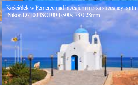
Kościół w Pamerze nad brzegiem morza strzegący portu Nikon D7100 ISO100 1/500s f/8.0 28mm