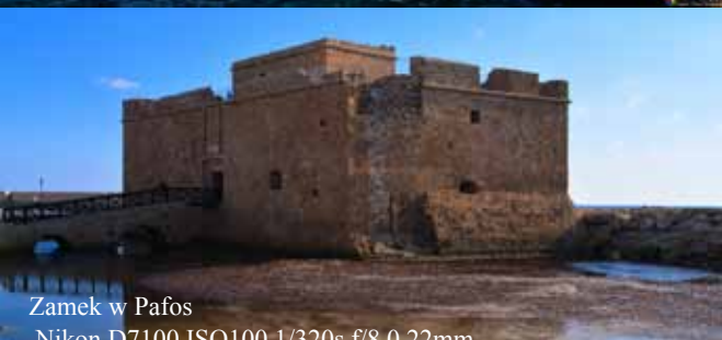
Zamek w Pafos Nikon D7100 ISO100 1/320s f/8.0 22mm